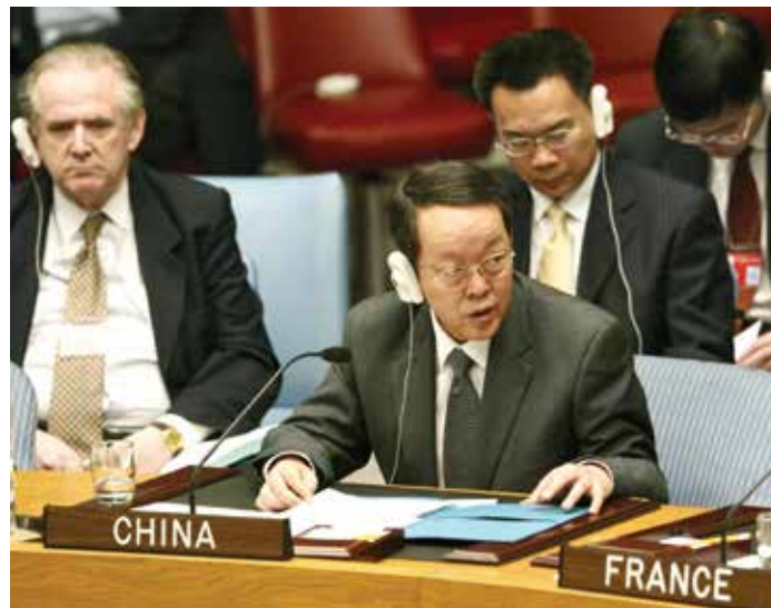
NYKYINEN KIELIMUURI Yhdistyneiden kansakuntien kokous vaatii monikielisen tulkkauksen väärinymmärrysten välttämiseksi.

3. Osa kansakunnista ja aatteista on yksityistä omistusoikeutta vastaan. Kommunistit ja sosialistit vastustavat