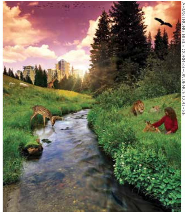
ARMSTRONG BIBLE CORRESPONDENCE COURSE

Valtaosaa ihmiskunnasta on petetty tänään, mutta ihanassa huomisen maailmassa ei petetä ketään! Ei ole paholaista johtamassa ihmistä harhaan. KAIKKI tulevat tuntemaan TOTUUDEN! Ei ole enää uskonnollista sekaannusta. Ihmisten silmät avataan ymmärtämään Jumalan ilmoittama totuus. Ihmiset alkavat OPPIA. Ihmiset alkavat noudattaa Jumalan ulossuuntautuvaa, toisista huolehtimisen TIETÄ—TODELLISTEN ARVOJEN—RAUHAN, ONNEN, HYVINVOINNIN JA ILON tietä!