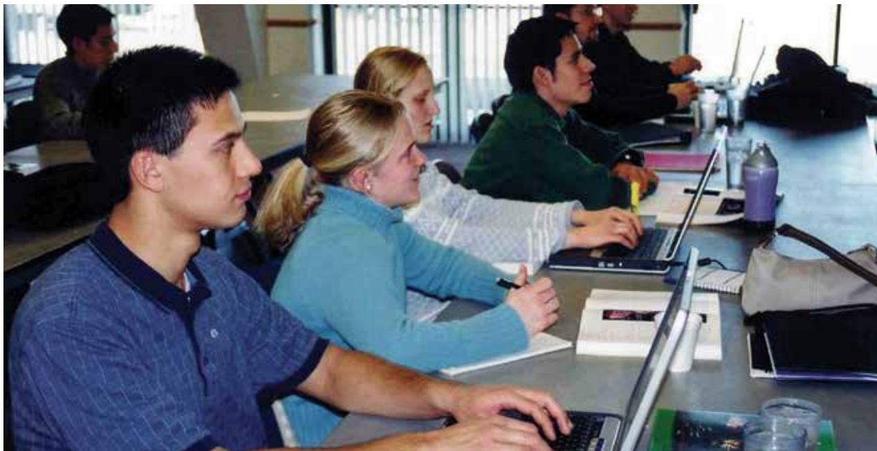
ARMSTRONG BIBLE CORRESPONDENCE COURSE

HUOMISEN KOULUTUS TÄNÄÄN Herbert W. Armstrong Collegen oppilaiden koulutus sisältää näyn Jumalan huomisen maailmasta. Armstrong College antaa esimakua huomisen maailman oppilaitoksista. AC:n motto on ”laajakatseinen koulutus”.