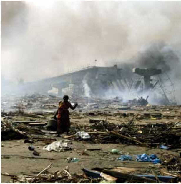
MAANJÄRISTYKSIÄ Raamattu ennustaa maanjäristysten sekä mm. Aasian 2004 tsunamikatastrofen kaltaisten vitsausten lisääntymisen.

seuraa väistämättömäsi sydämen, keuhkojen ja yleensä koko kehon heikentyminen , mikä alentaa vastustuskykyä tauteja kohtaan, ja taudit iskevät lähes aina ensin heikkoihin ihmisiin!