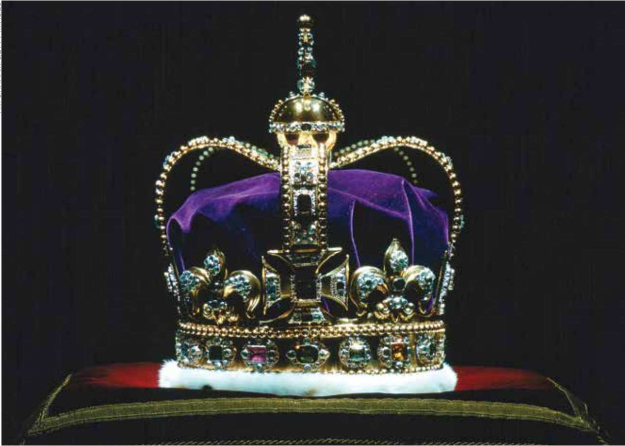
HALLITUSVALLAN SYMBOLI Näyttävä Englannin kruunajaiskruunu. Raamattu kertoo, että Jeesus Kristus valmistaa nyt taivaassa pyhille hänen palatessaan myönnettäviä hallitusasemia.

(no man, kukaan ihminen) taivaassa... voinut avata kirjaa. ”No man” on väärä käännös Kreikan alkutekstistä. Revised Standard Version, Revised Authorized Version, Moffatt-käännös, New English Bible ja New International Version kääntävät kaikki ilmaisun ”ei kukaan”.