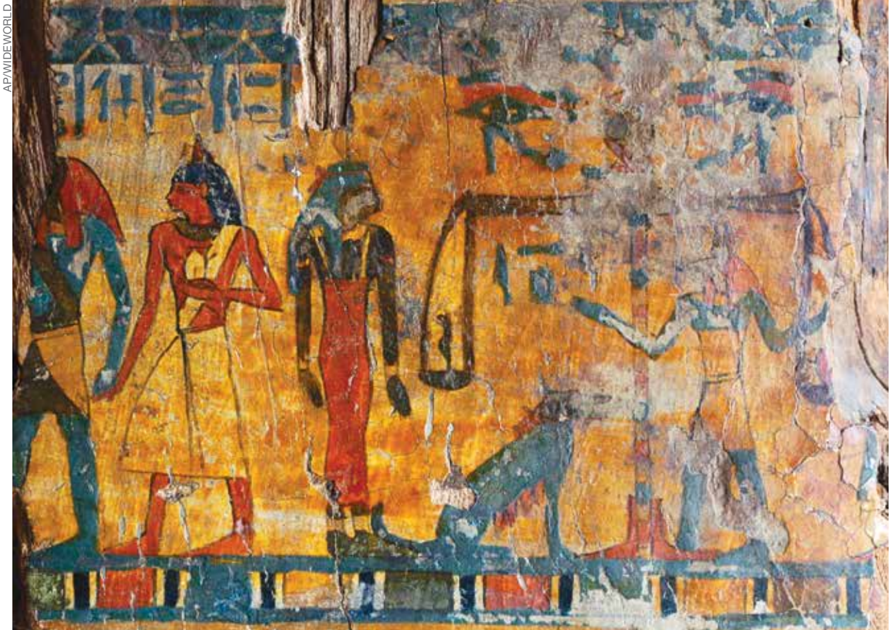
EGYPTIN ”KUOLLEIDEN KIRJA” Kuvan kirjan ohjeiden oli määrä opastaa kuolleita Egyptin ”taivaaseen” matkaavia ”alamaailmassa”.