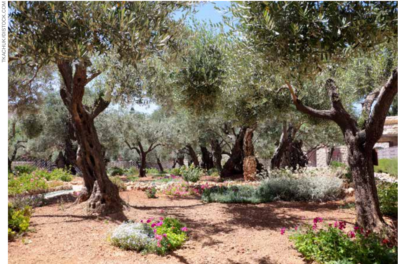
GETSEMANE Öljypuita Getsemanen puutarhassa, jossa Kristus rukoili lähes 2000 vuotta sitten Jumalan tahdon toteutumista ennen kaikkien aikojen vakavinta oikeudenkäyntiä.

Koska seurakunta on instrumentti, jonka kautta Jumalan toteuttaa työnsä maan päällä Kristuksen ja