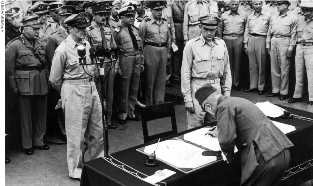
EHDOTTA ANTAUTUMINEN Japanin keisarillisen päämajan edustaja kenraali Umezo allekirjoittaa USS Missouriin kannella antautumissopimuksen kenraali MacArthurin läsnä ollessa. Tämän toisen maailmansodan dokumentin allekirjoitus kuvaa todelliseen parannukseen liittyvää täydellistä, ehdotonta antautumista Jumalalle.

Pyhä Henki ei kuitenkaan poista vapaata moraalista tilaamme. Se ei pakota meitä mihinkään. Se vain JOHTAA meitä Jumalan totuuden suuntaan ja antaa meille hengellisen voiman Jumalan tahdon toteuttamiseksi.