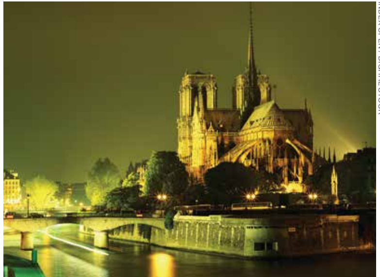
INDEX OPEN / DIGITAL STOCK