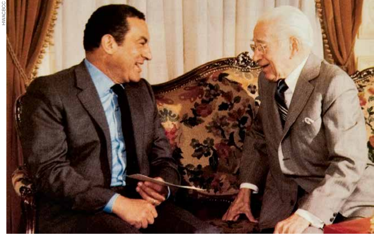
EVANKELIUMI MAAILMAN JOHTAJILLE Jumalan ”lähetetty” apostoli julisti maailmanlaajuisesti valtionpäämiehille tulevan Jumalan valtakunnan hyvää uutista. Kuvassa (oikealla) Herbert W. Armstrong ja Egyptin presidentti Hosni Mubarak vuonna 1983.

jota Kristus opetti kirjallisen Sanansa kautta, opetti näitä samoja oppeja. Jumalan profeetta opettaa uskollisesti tänään samoja oppeja alaisilleen pastoreille, jotka puolestaan opettavat sapattina Jumalan yhden tosi seurakunnan jäsenille samoja oppeja saman mielisistä jäsenistä koostuvissa seurakunnissa ympäri maailmaa!