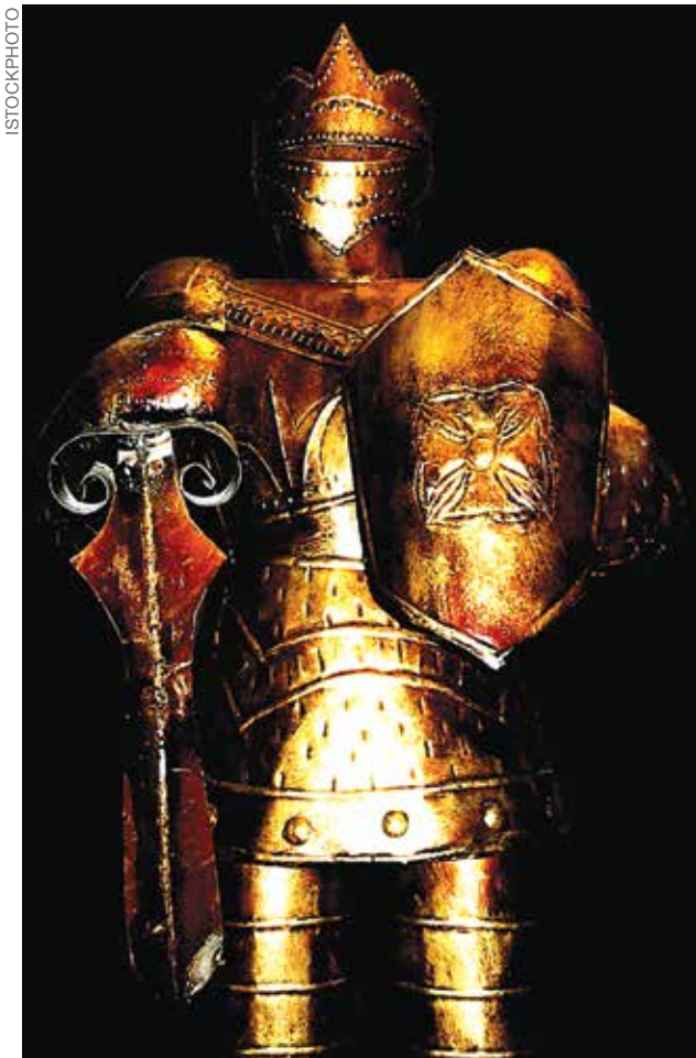
SOTA-ASU Apostoli Paavali vertaa sotilaan haarniskaa hengelliseen sota-asuun, joka kristityn tulee pukea päällensä voittaakseen hengelliset taistelunsa.

Ennen kuin Jeesus Kristus saattoi pätevoityä palauttamaan Jumalan hallituksen ja hallita kaikkia kansoja, hänen täytyi ensin kyetä vastustamaan saatanan kovimpia kiusauksia. Matteuksen evankeliumin 4 luvusta löytyy kuvaus tästä kamppailusta. Huomaa, kuinka paholainen yritti pettää Jeesuksen Kristuksen ja saada hänet tekemään syntiä Jumalaa vastaan.