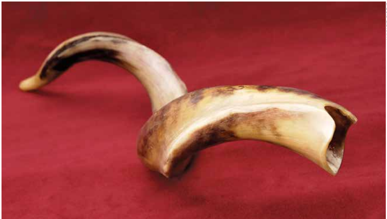
PASUUNANSOITTO Shofar-soitin saa aikaan mahtavan pasuunan töräytyksen, joka pasuunansoiton päivän täytyessä ilmoittaa Kristuksen palaavan asettamaan valtakuntansa maan päälle.

Eli sovituspäivänä paastoaminen on eloisa muistutus pelastukseen tarvittavasta mielenlaadusta—nöyryydestä, jumalallisesta murheesta, totisesta Jumalan tien etsimisestä—mielenlaadusta, johon tämän maailman ihmiset saatetaan, kun katastrofiset tapahtumat kulminoituvat Jeesuksen Kristuksen paluuseen!