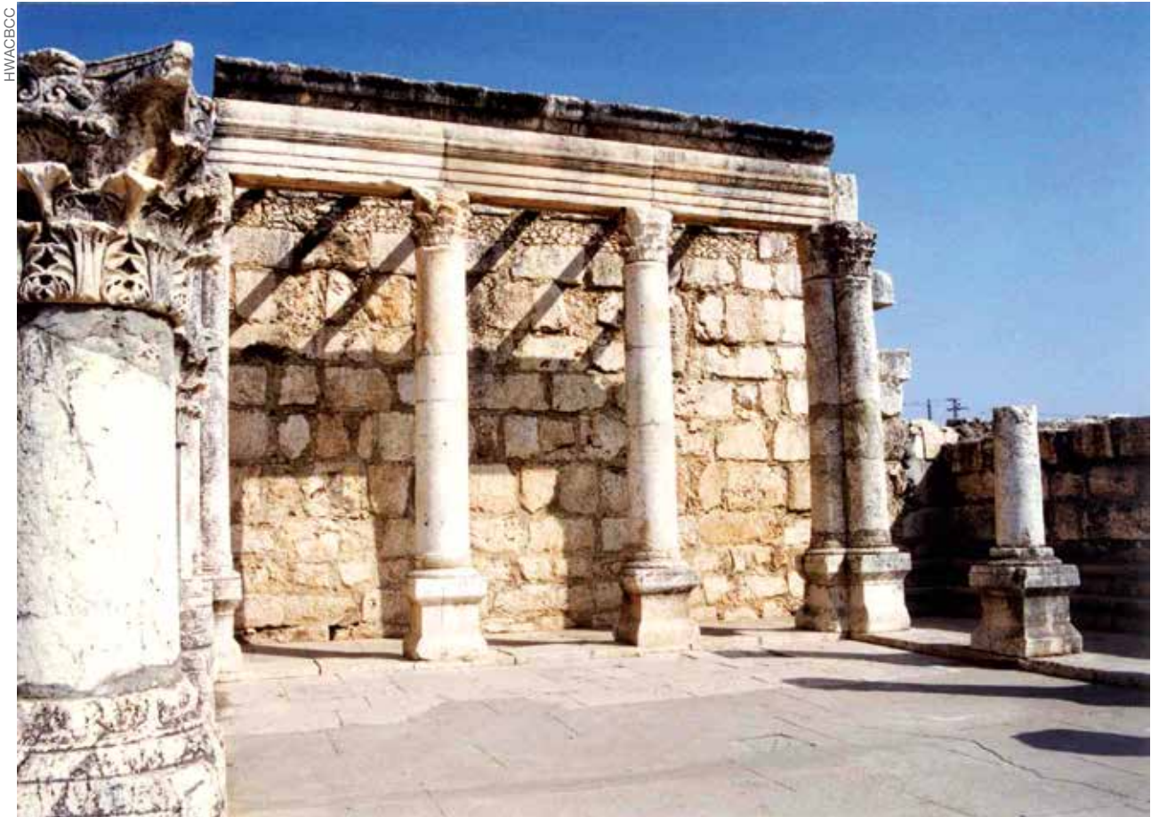
SYNAGOGA Tämän osittain kunnostetun Kapernaumin synagogan uskotaan seisovan sen alkuperäisen synagogan paikalla, jossa Kristus opetti” tapansa mukaan” seitsemännen päivän sapattina (Luuk. 4:16,31).

Jumala määräsi sapatin pidosta kaksin kerroin tekemällä erillisen sitä koskevan liiton kansansa Israelin kanssa. (Sapatti oli jo yksi Jumalan Moosekselle lyhyesti ennen vanhan liiton vahvistamista annetusta kymmenestä käskystä.) Sapatin pidosta tuli ikuinen